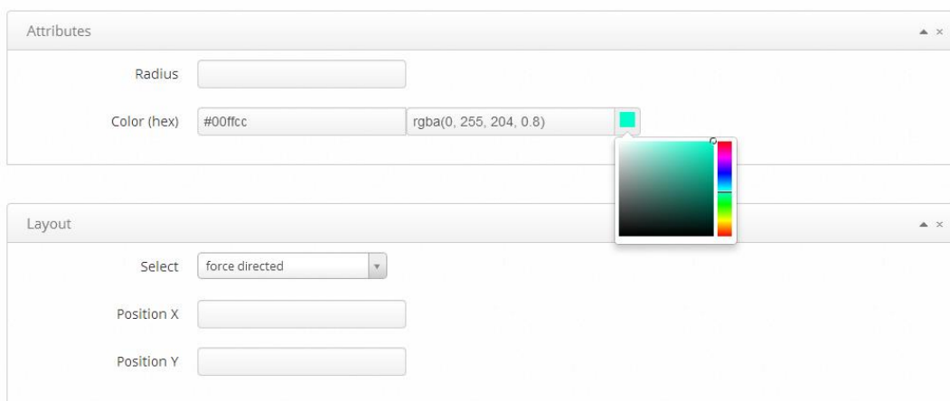
图 1（属性和布局的整体样式）